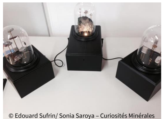
© Edouard Sufrin/ Sonia Saroya – Curiosités Minérales

Atelier artistique pour les enfants : Fabrication de petits transistors à partir de minéraux que l'on retrouve dans les téléphones portables.