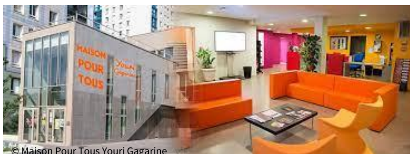
© Maison Pour Tous Yuri Gagarine