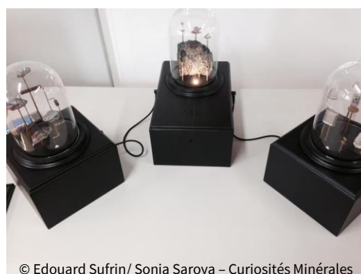
© Edouard Sufrin/ Sonia Saroya – Curiosités Minérales

Expérience en famille : Visite ludique de la Micro-Folie. Découverte d'une installation interactive qui explore de manière poétique les liens entre numérique et environnement, en mettant en scène certains minéraux servant à fabriquer des composants électroniques. Artistes : Edouard Sufrin et Sonia Saroya – Œuvre : "Curiosités minérales"